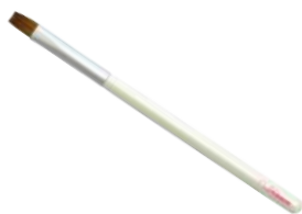
リップブラシ 【K-7】 2,090円