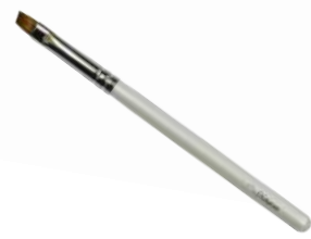
アイブロウブラシ 【HWP-3】 1,320円 ●使用原毛：オロンビー ●全長：129mm ●毛丈：9/7mm