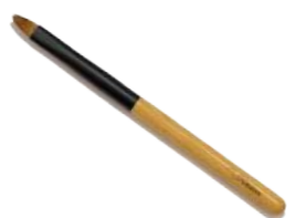
リップブラシ (山振) 【CB-4】 1,760円