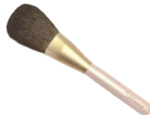
フェイスブラシ 【HRsp-P1】 19,800円