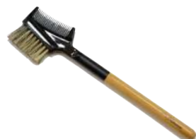
ブラシ&コム 【CB-5】 1,320円