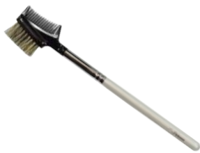
ブラシ&コーム 【HWP-5】 1,100円 ●使用原毛：馬のたてがみ ●全長：163mm

ビギナーズシリーズについて ブラシメイクを始める方に! 初心者の方用に開発した商品です。