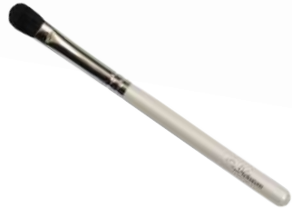
アイシャドウブラシ 【HWP-2】 1,320円 ●使用原毛：馬毛 ●全長：146mm ●毛丈：16mm