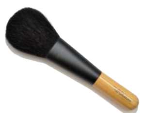
フェイスブラシ 【CB-1】 5,500円