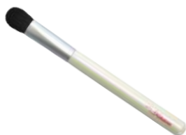
アイシャドウブラシ（丸型） 【K-4】 1,980円