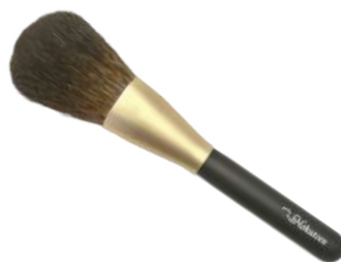
フェイスブラシ 【HRsp-B1】 19,800円