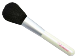
チークブラシ 【K-2】 3,575円