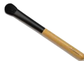
アイシャドウブラシ 【CB-3】 1,650円