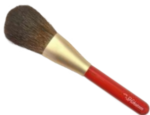
フェイスブラシ 【HRsp-R1】 19,800円