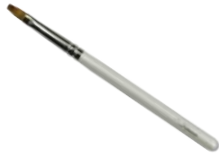
リップブラシ 【HWP-4】 1,540円 ●使用原毛：イタチ ●全長：132mm ●毛丈：11mm