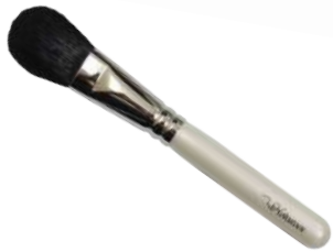
チークブラシ 【HWP-1】 3,080円 ●使用原毛：羊毛 ●全長：145mm ●毛丈：35mm