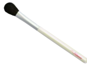
アイシャドウブラシ（山型） 【K-3】 2,090円