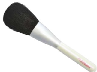
フェイスパウダーブラシ 【K-1】 6,490円