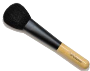
チークブラシ 【CB-2】 3,520円