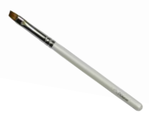
アイブローブラシ 【HWP-3】 1,320円 ●使用原毛：オロンビー ●全長：129mm ●毛丈：9/7mm