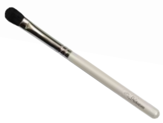
アイシャドウブラシ 【HWP-2】 1,320円 ●使用原毛：馬毛 ●全長：146mm ●毛丈：16mm