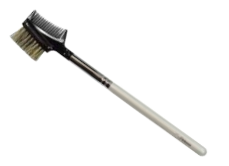
ブラシ&コーム 【HWP-5】 1,100円 ●使用原毛：馬のたてがみ ●全長：163mm

ビギナーズシリーズについて ブラシメイクを始める方に! 初心者の方用に開発した商品です。