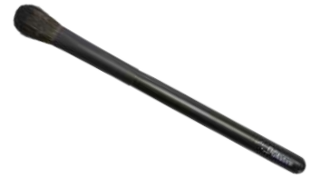
アイシャドウブラシ（山型） 【K-3】 2,090円