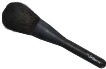
フェイスパウダーブラシ 【K-1】 6,490円