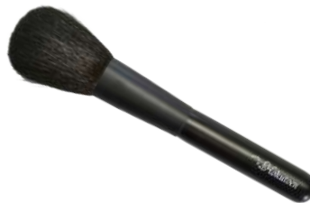
チークブラシ 【K-2】 3,575円