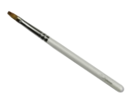
リップブラシ 【HWP-4】 1,540円 ●使用原毛：イタチ ●全長：132mm ●毛丈：11mm